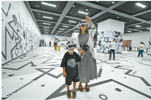
游客在VR沉浸式体验《丛林探秘》。

内蒙古博物院(新馆)已开馆试运行,连日来,众多市民与游客纷至沓来,共同见证这座文化新地标的璀璨亮相。