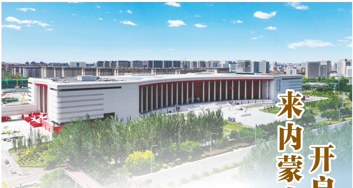
内蒙古博物院新馆。