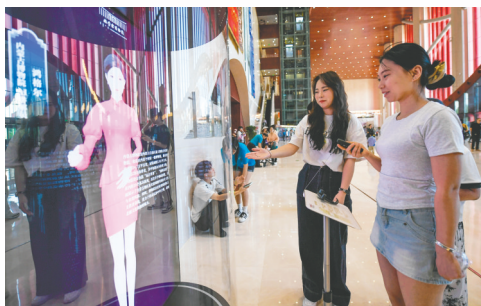
全息投影讲解员“鸿格尔”闪亮登场。