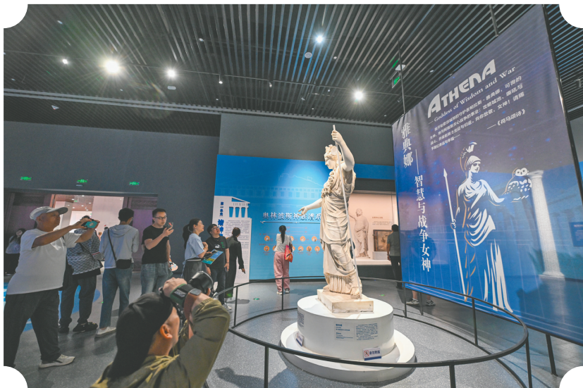
“古希腊之美——那不勒斯国家考古博物馆馆藏文物精品展”展出。