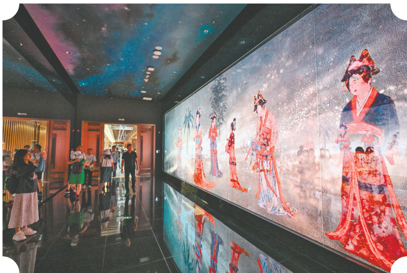
以数字化形式展示的唐代墓葬壁画《寄锦图》吸引市民游客驻足观看。