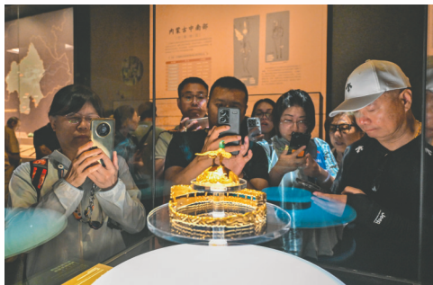
观众欣赏镇馆之宝鹰顶金冠饰。