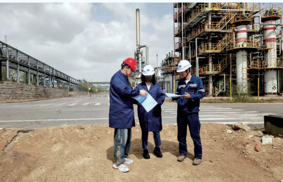
阿拉善高新区以“一对一”精准服务为抓手,让企业办事从“多头跑”变为“指尖办”,为园区高质量发展按下“快捷键”。