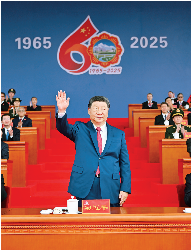
8月21日上午,西藏各族各界干部群众约2万人欢聚拉萨市布达拉宫广场,热烈庆祝西藏自治区成立60周年。中共中央总书记、国家主席、中央军委主席习近平出席庆祝大会。