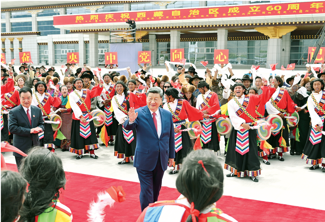
新华社拉萨8月21日电 中共中央总书记、国家主席、中央军委主席习近平在拉萨出席西藏自治区成立60周年庆祝活动后,21日乘专机返回北

央军委关于庆祝西藏自治区成立60周年的贺电。(全文另发) 王沪宁向西藏自治区赠送习近平题词的“共建中华民族共同体 书写美丽西藏新篇章”贺匾。 王沪宁发表讲话。他说,1965年9月,在党中央亲切关怀和党的民族政策光辉照耀下,西藏自治区宣告成立。这是西藏发展史上具有划时代意义的大事,巩固了西藏和平解放和民主改革的伟大成果, ■下转第3版