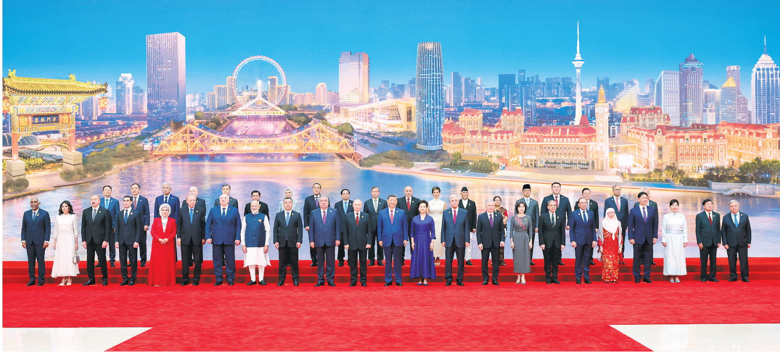
8月31日晚，国家主席习近平和夫人彭丽媛在天津梅江会展中心举行宴会，欢迎来华出席2025年上海合作组织峰会的国际贵宾。这是宴会前，习近平和彭丽媛同贵宾们集体合影留念。