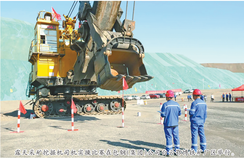
露天采矿挖掘机司机实操比赛在包钢(集团)公司白云鄂博铁矿厂区分区举行。

包头职业技术学院承办的CAD机械设计理念实操比赛,在该校勤务楼204室开赛,选手需完成机械零件三维建模与工程图绘制,全程开放观摩,展现数字设计领域的技能水准。九原区总工会的信息系统运营维护实操比赛同