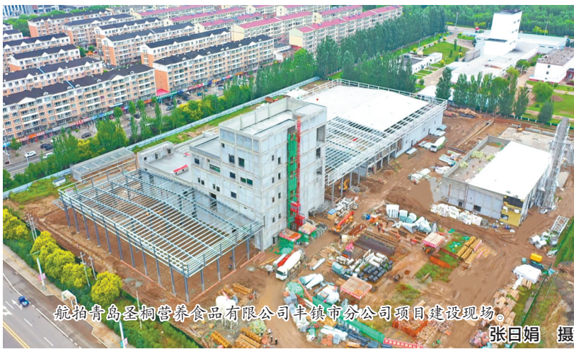
航拍青岛圣桐营养食品有限公司丰镇市分公司项目建设现场。