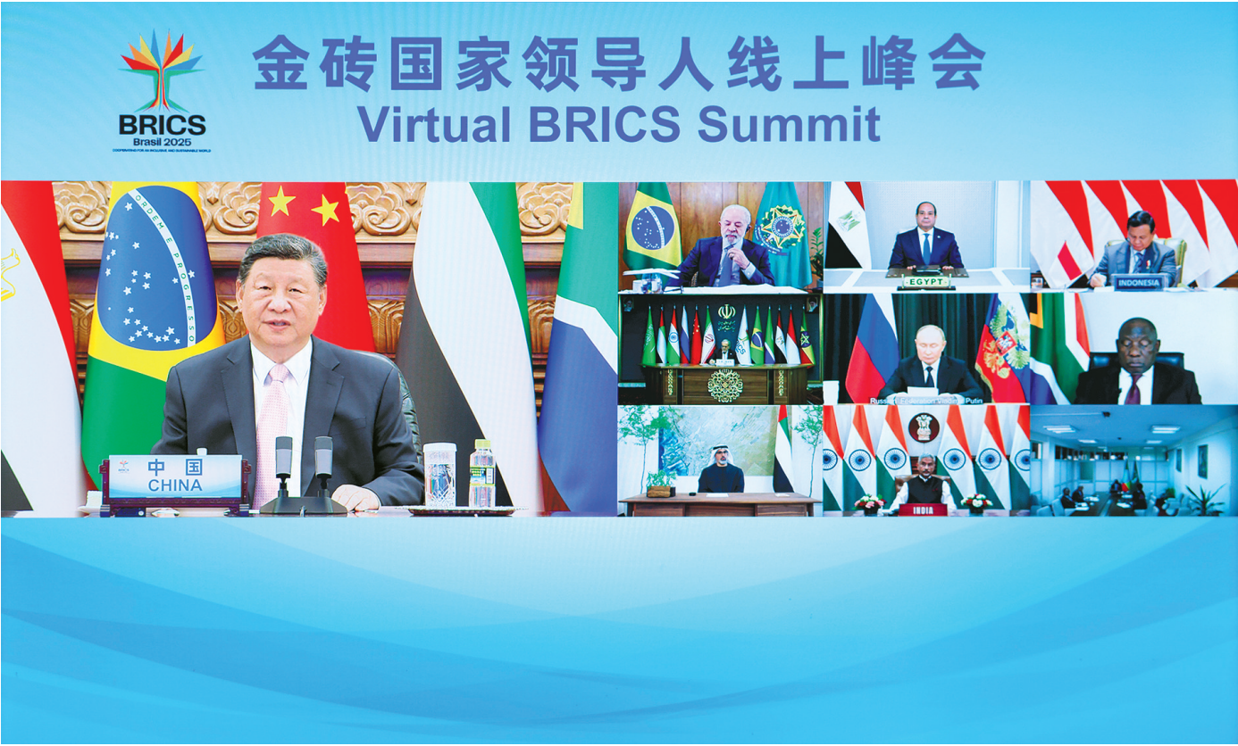
9月8日晚,国家主席习近平出席金砖国家领导人线上峰会,并发表题为《团结合作 砥砺前行》的重要讲话。