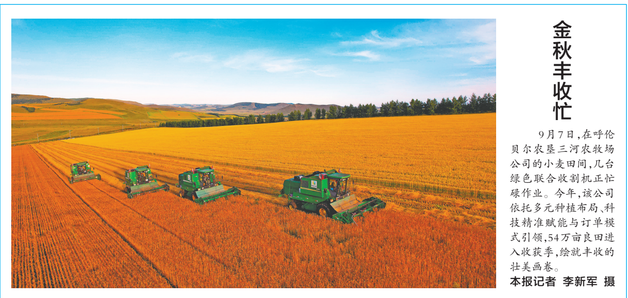
金秋丰收忙 9月7日，在呼伦贝尔农垦三河农牧场公司的小麦田间，几台绿色联合收割机正忙碌作业。今年，该公司依托多元种植布局、科技精准赋能与订单模式引领，54万亩良田进入收获季，绘就丰收的壮美画卷。

与海关、边检等联检单位的沟通联系，高效组织中欧班列通关审核、优先查验、换装放行等环节，通关效率大幅提升。 “我们针对中欧班列运输需求，重新划分装卸作业区域，增加专用作业线，再加上‘绿色通道’优先保障，现在单趟班列的口岸停留时间可压缩到4小时以内。”中国铁路呼和浩特局集团有限公司二连站技术科科长杨冬冬介绍道。 截至9月8日，二连浩特铁路口岸今年累计接运中欧班列2646列，运送货物348.76万吨，同比分别增长9.5%、15.4%。