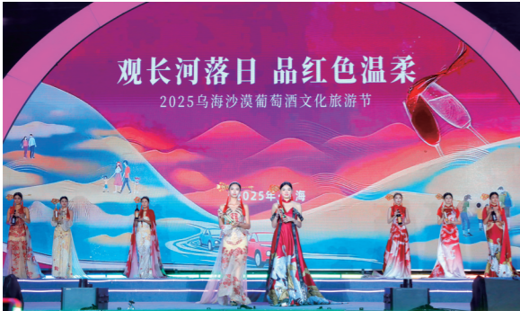
乌海沙漠葡萄酒展示秀。