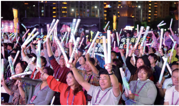
市民、游客热情参与乌海沙漠葡萄酒文化旅游节。