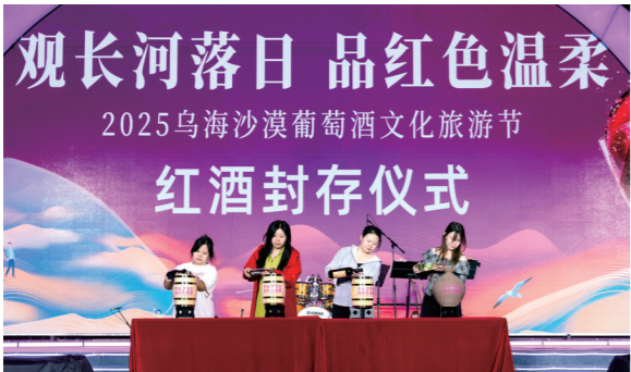
闭幕式上的红酒封存仪式。