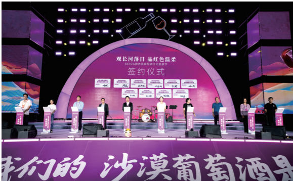
闭幕式上的合作签约仪式。