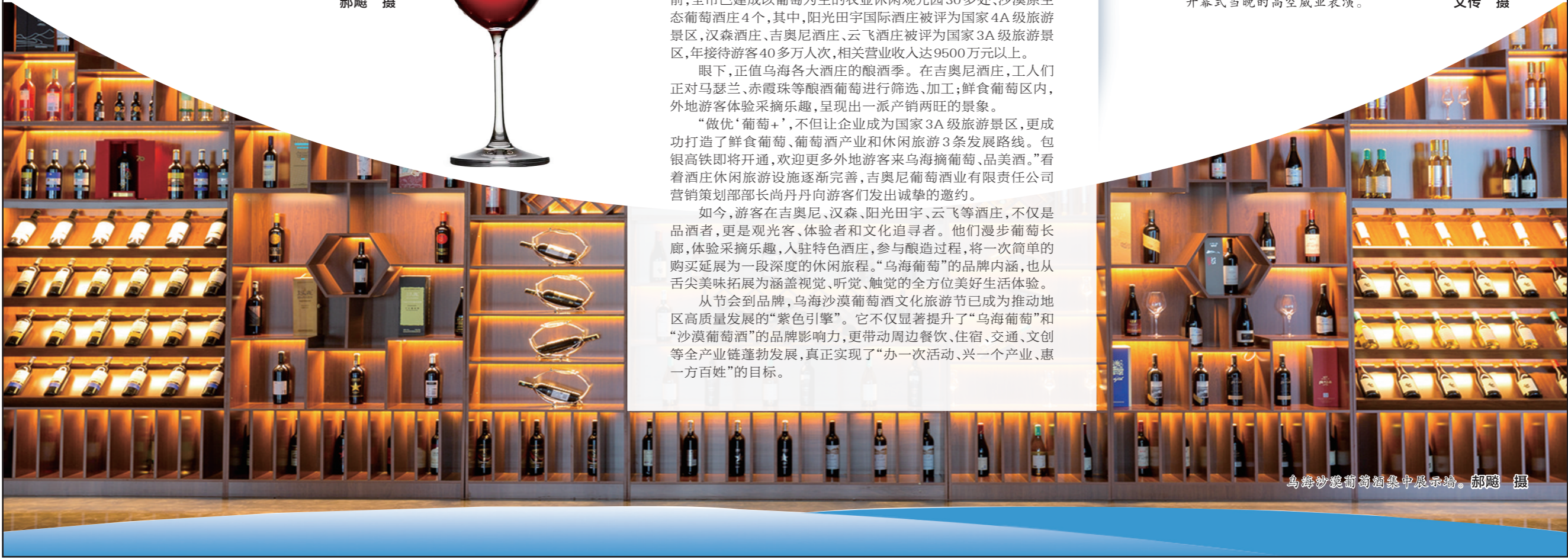
乌海沙漠葡萄酒集中展示墙。