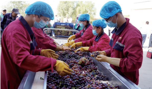
乌海葡萄开榨酿酒。