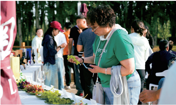
各地客商品味乌海葡萄。