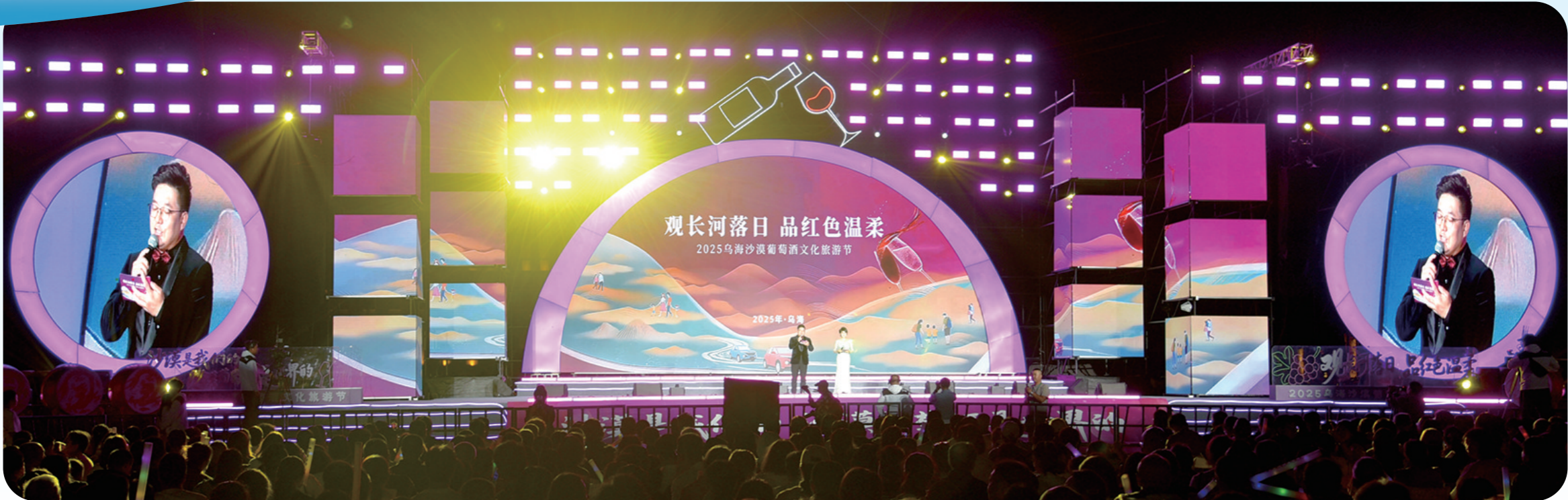
2025乌海沙漠葡萄酒文化旅游节开幕式现场。