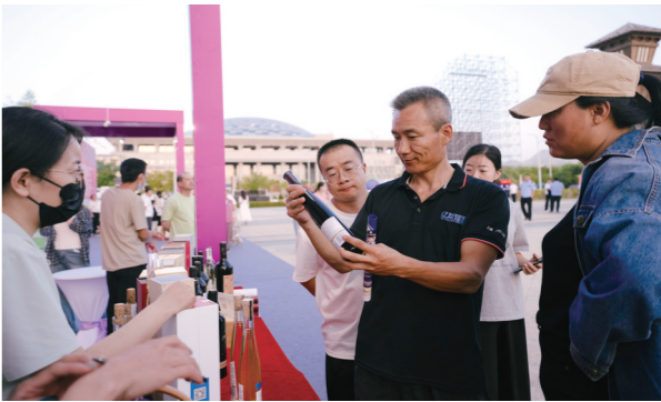
游客在活动现场选购葡萄酒。

从节会到品牌,乌海沙漠葡萄酒文化旅游节已成为推动地区高质量发展的“紫色引擎”。它不仅显著提升了“乌海葡萄”和“沙漠葡萄酒”的品牌影响力,更带动周边餐饮、住宿、交通、文创等全产业链蓬勃发展,真正实现了“办一次活动、兴一个产业、惠一方百姓”的目标。