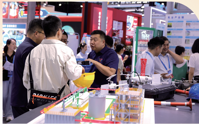
一线职工与观众交流互动。