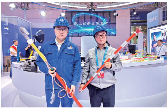
电力行业职工展示“五小”创新成果。