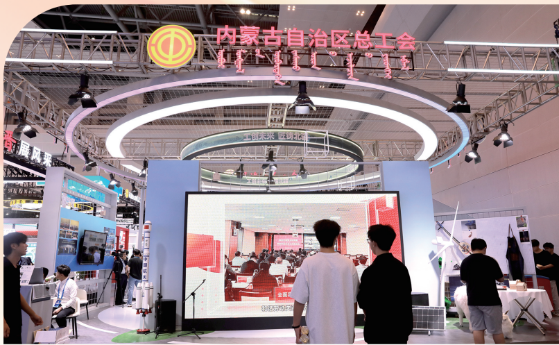
观众参观内蒙古自治区总工会展区。