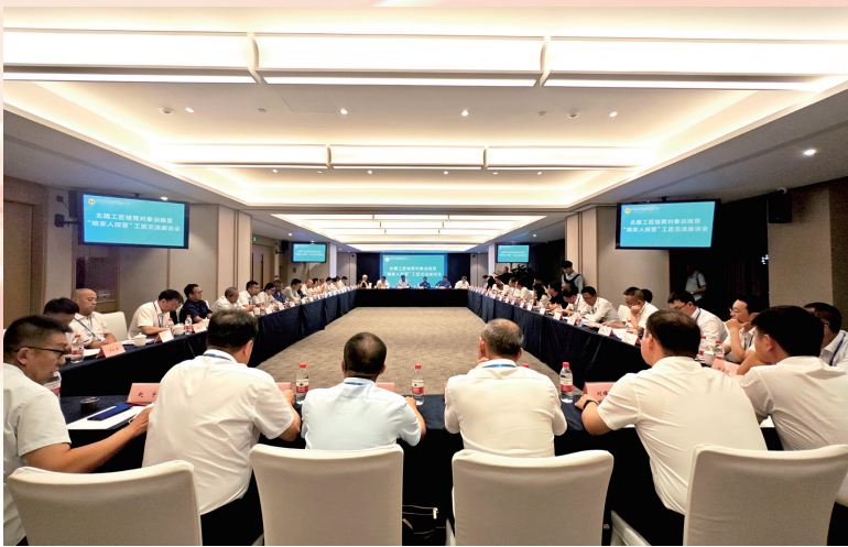
北疆工匠培育对象训练营“娘家人探营”工匠交流座谈会现场。