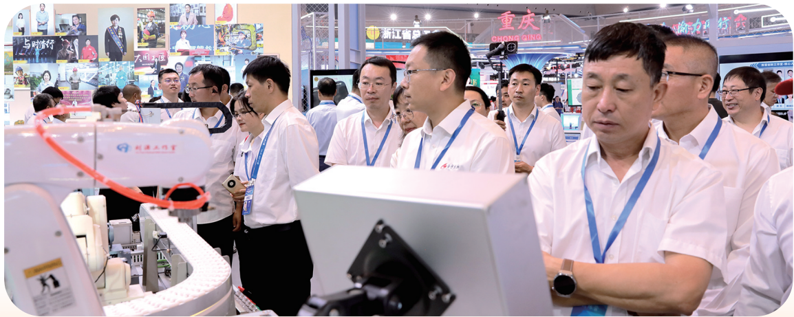
北疆工匠培育对象参观学习。

“我们不仅要‘走出来’展示自己,更要‘带回去’先进经验。”自治区总工会相关负责人表示,这些跨区域的交流成果,将成为推动内蒙古产业工人队伍技术水平提升的重要动力。