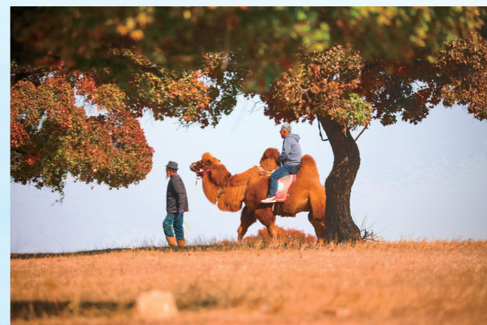
骑驼漫游五角枫林。