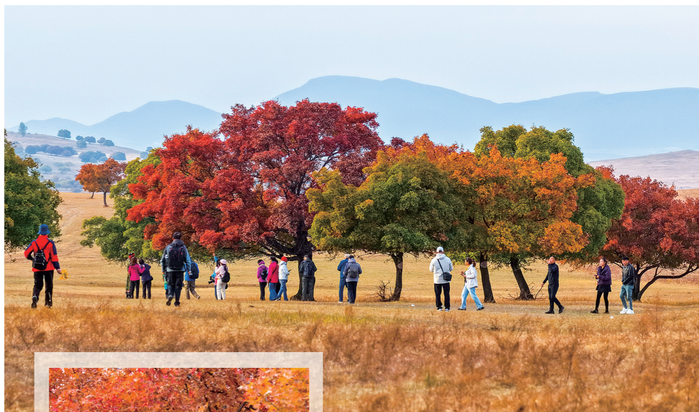
秋染五角枫,游人打卡醉秋光。

眼下秋意正浓,枫色如焰,这场秋日“焰火”盛大却短暂。别让城市的喧嚣困住脚步,趁枫红正好、时光未晚,来科右中旗吧!赴一场与五角枫的醉人之约,把这抹绚烂的秋,刻进今年最难忘的记忆里。