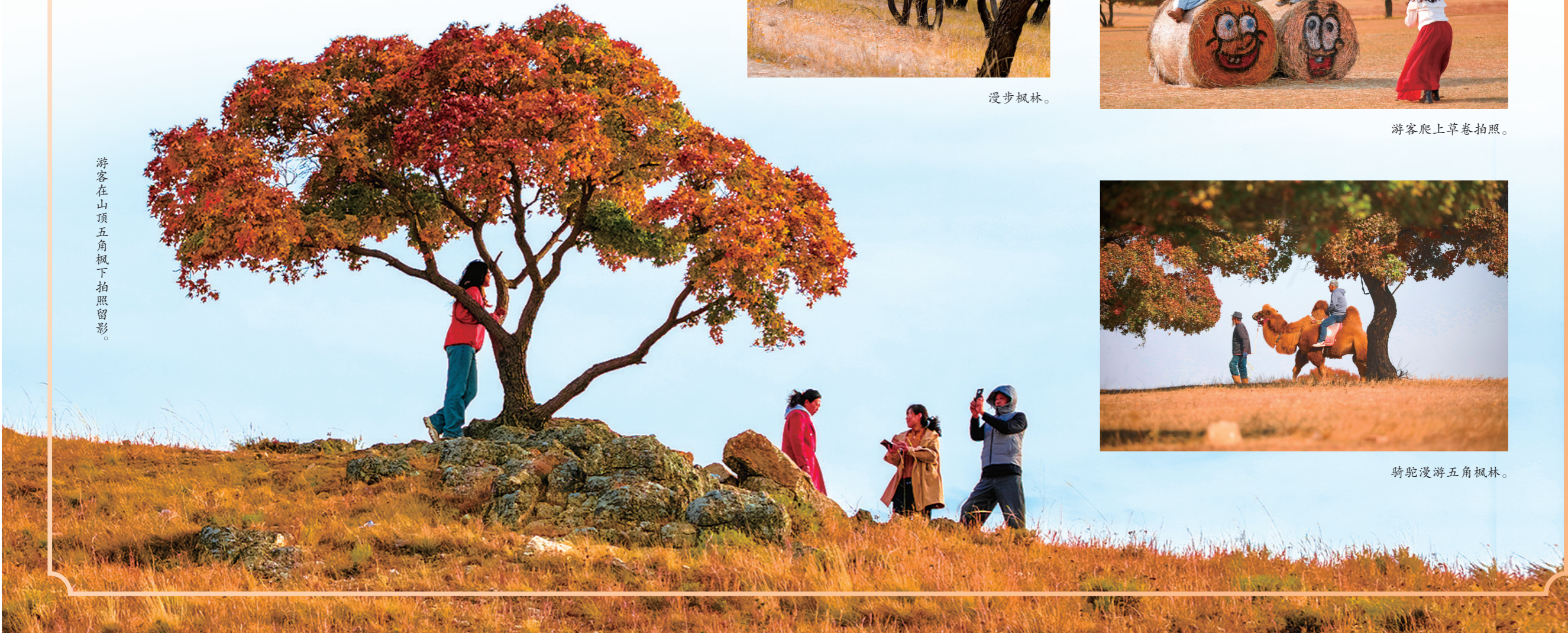
游客在山顶五角枫下拍照留影。