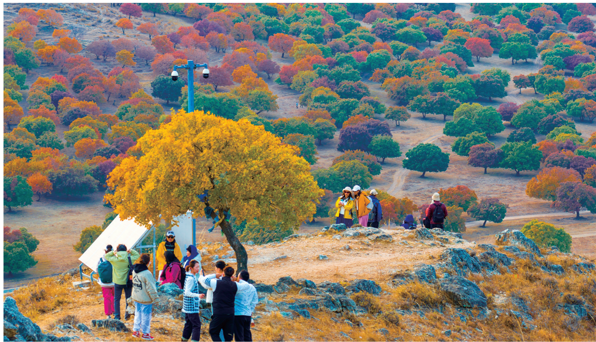
登高赏秋景,枫林五彩醉游人。