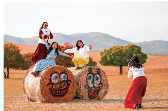
游客爬上草卷拍照。