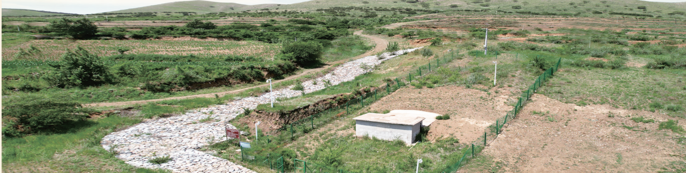
陈国公主及驸马合葬墓地貌