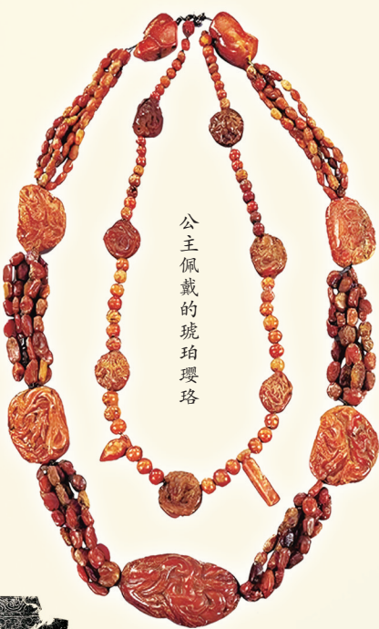
公主佩戴的琥珀璆瑠