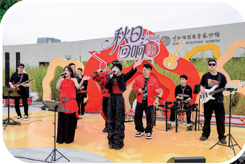
秋日回响音乐派对。

这股商业新风潮正在呼和浩特市各处绽放。在新城区,水岸漫街以其独特的欧美风格建筑群成为新晋打卡地。12栋单体建筑内汇聚品牌餐饮、特色酒吧、精致茶舍,风情集市与创意集装箱店铺相映成趣,构筑了一幅异域风情与本地生活交融的生动画面。与此同时,比嘉塔商业街在夜幕降临时焕发出别样魅力,霓虹闪烁点亮成吉思汗大街,不仅成为美食聚集地,更化身夜景绝佳观赏点,为青城的夜经济增添了一抹浪漫色彩。