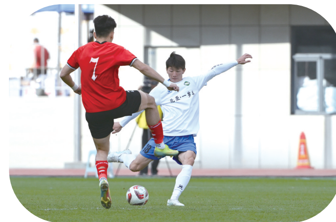
呼和浩特市足球队比赛。