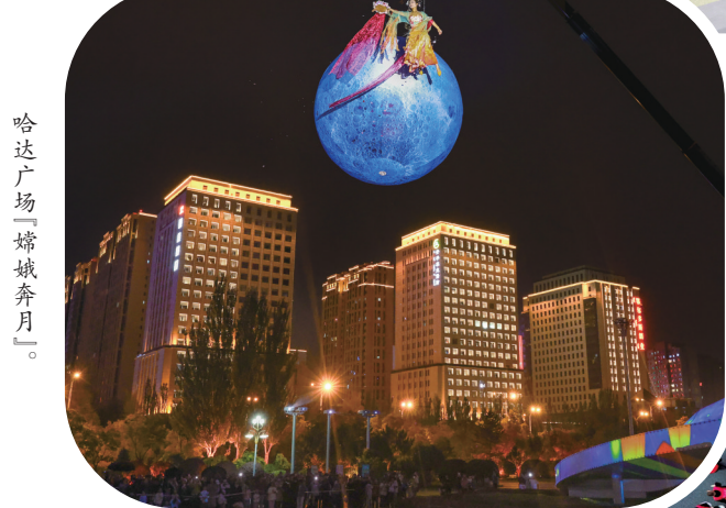
哈达广场“绿城秋月”。