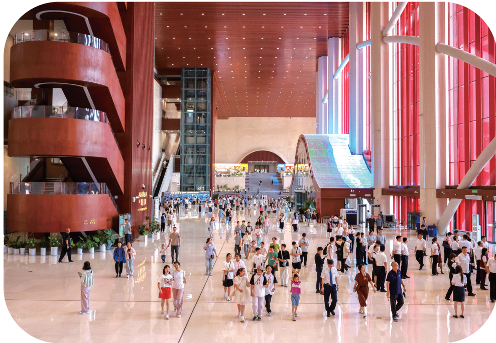
内蒙古博物院内部人流量。