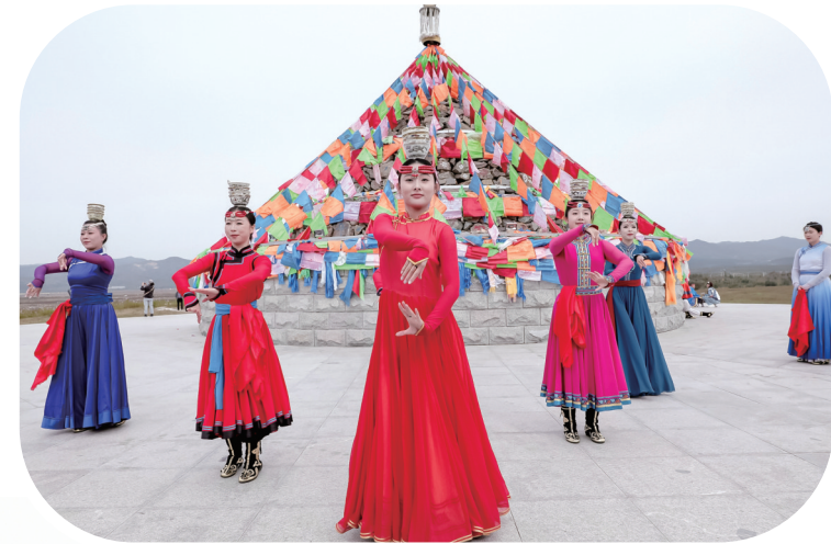
演员在敕勒川生态包公祠表演。

“我们要让游客看到,呼和浩特市不仅有草原牧歌,更有科技脉搏。”市文旅局负责人表示,科技文旅的火爆并非偶然,而是城市近年来持续推进“文旅+科技”战略的成果。从乳业工厂的智能化升级,到场馆的数字改造,再到智慧服务的全面覆盖,呼和浩特市正以科技为笔,重新书写首府文旅的新图景。