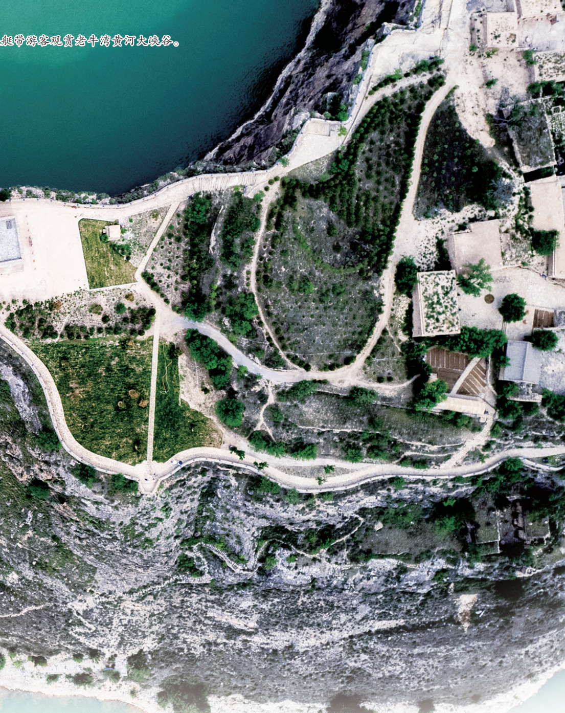
呼和浩特市博物馆新馆。