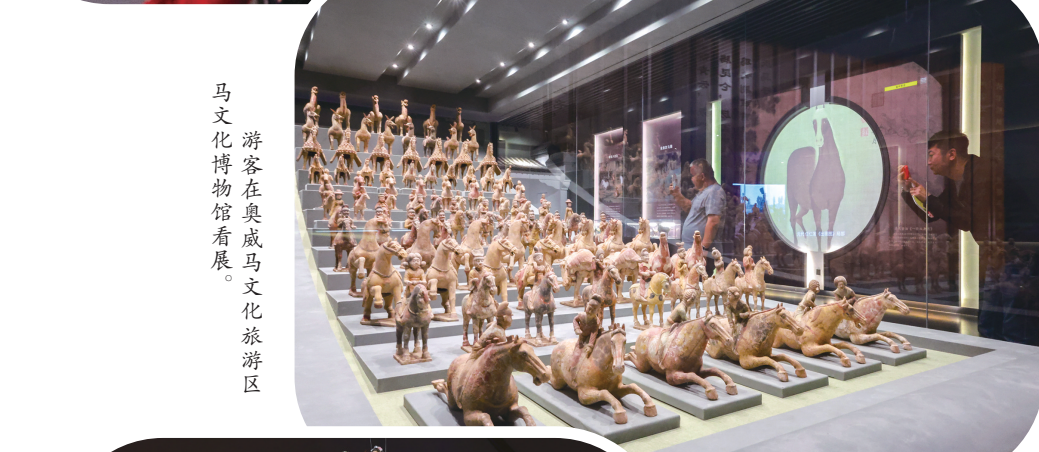
游客在内蒙古博物院参观。