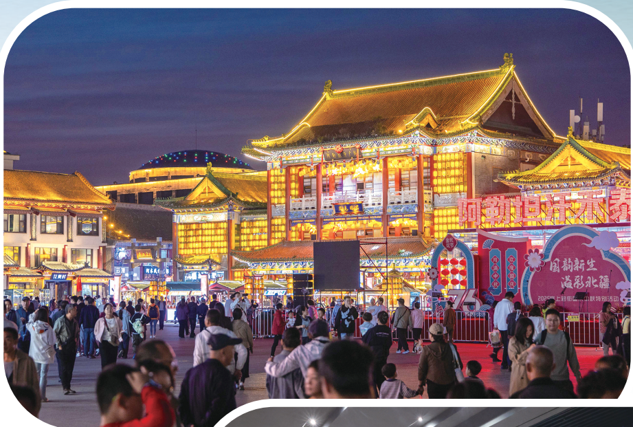
国庆假期,五原区塞上老街游客络绎不绝,吸引众多外地游客。

从满足味蕾的美食牛街,到装扮街角的花墙;从自然天成的网红草垛,到艺术交融的音乐派对,这些新地标与传统景点相辅相成,共同构成了呼和浩特市文旅矩阵的新版图。它们不仅是游客拍照打卡的背景板,更是这座城市不断自我更新、释放内在活力的生动证明,让“青城”在国庆期间展现出不同于往日一线城市的时尚吸引力与文化包容性。