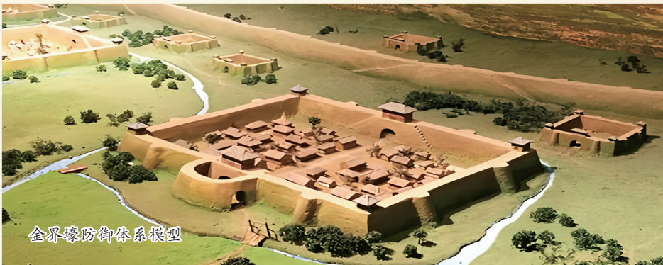
金界壕防御体系模型