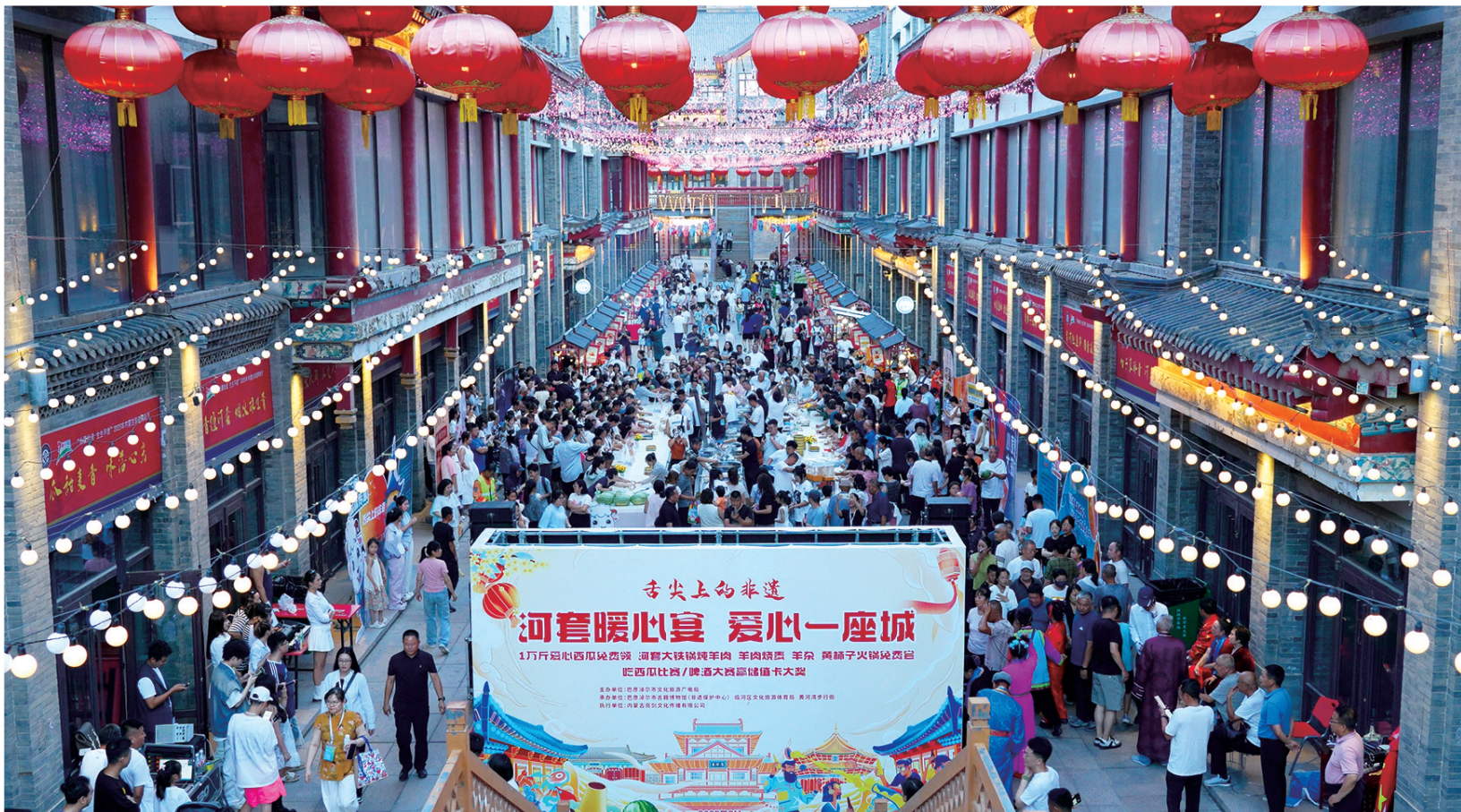
以“北疆拾遗 生生不息”为主题的2025年内蒙古非遗购物月活动现场。