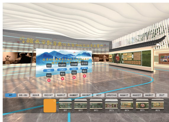
内蒙古数字非遗馆。