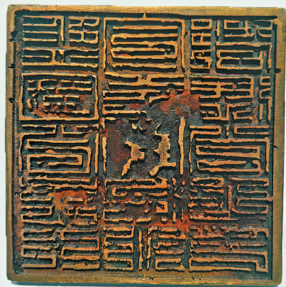
监国公主铜印正面