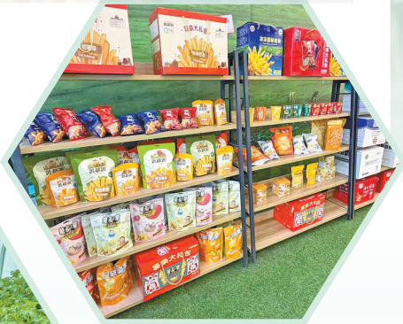
内蒙古薯都凯达食品有限公司展示的各类马铃薯产品。