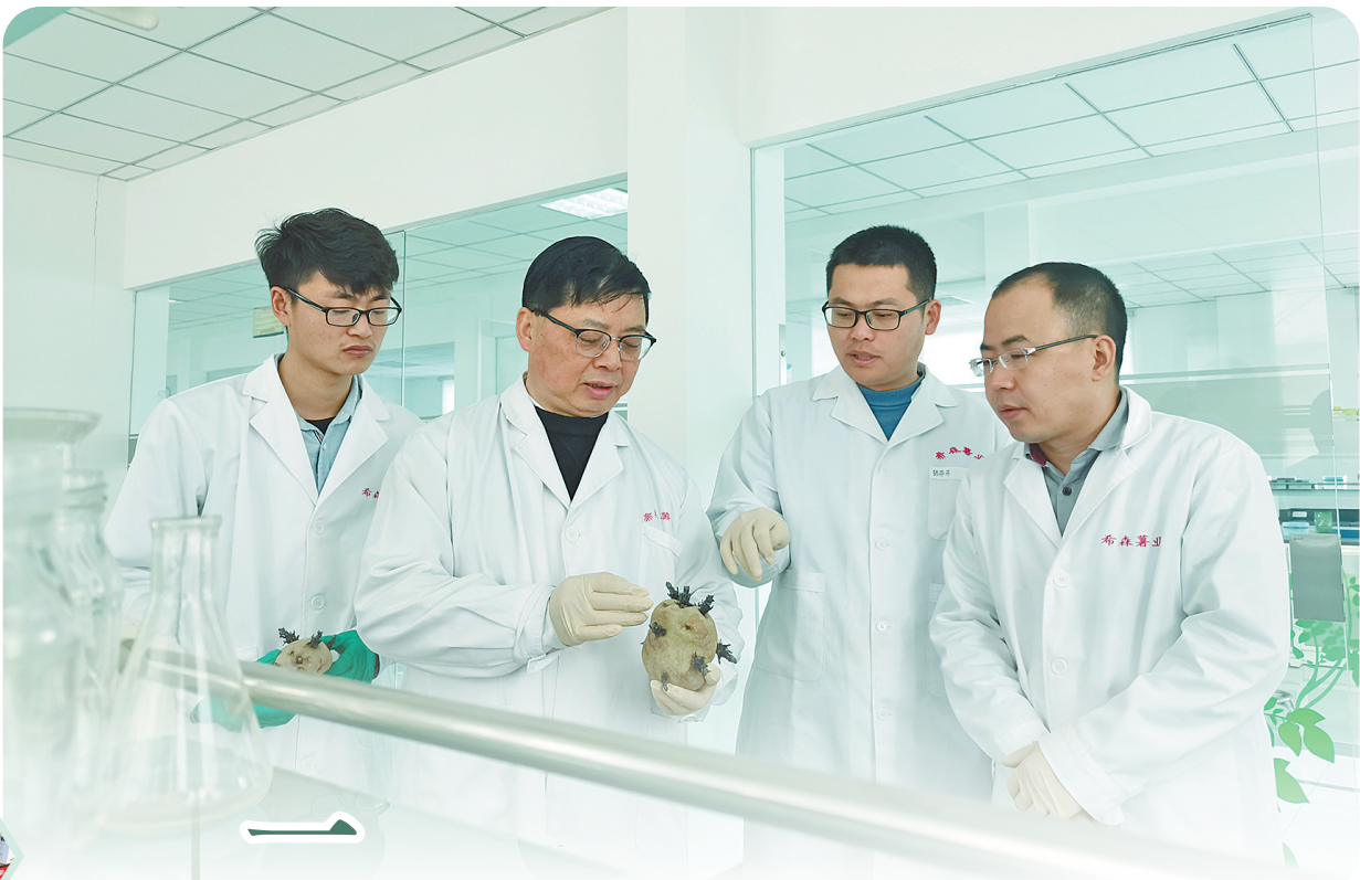
科研人员观察讨论薯块的光发芽性状。