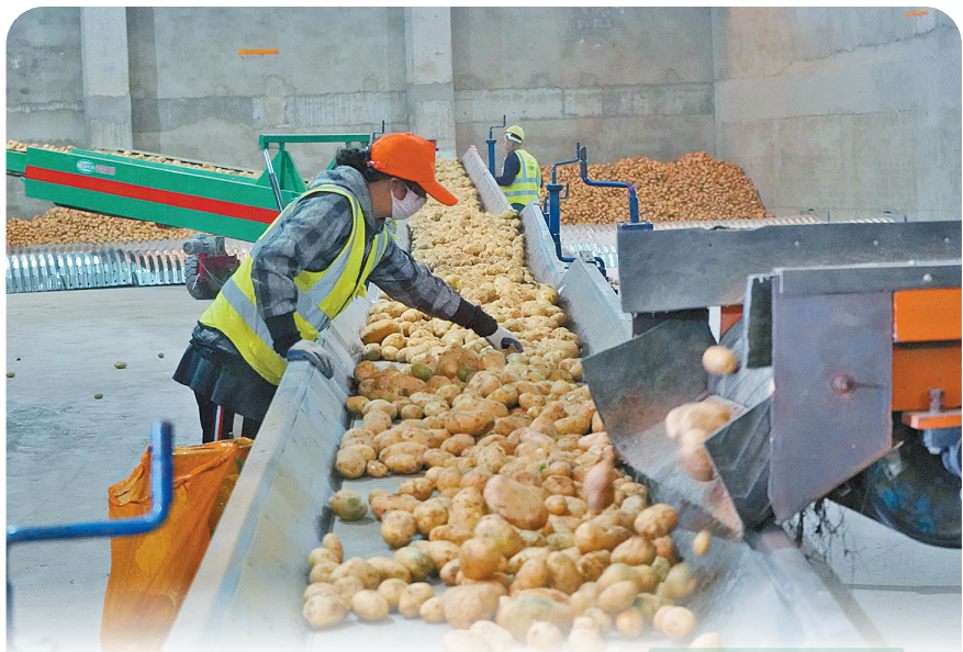
分拣马铃薯。(资料图)