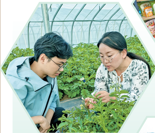
科研人员在马铃薯杂交棚内进行授粉。