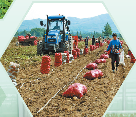
马铃薯丰收。(资料图)