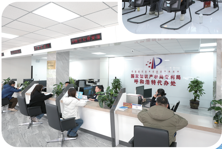
内蒙古自治区知识产权保护中心 国家知识产权局专利局呼和浩特代办处 业务受理大厅业务咨询。