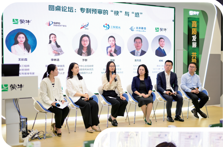
与业界人士共话知识产权保护。