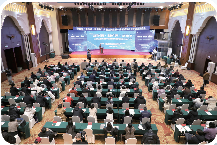
举办内蒙古新能源产业领域专利预审业务宣介会。

目前,该公司两件专利均成功获得授权,实现了“既能有效阻止他人模仿专利技术,又能覆盖较宽保护范围”的目标,实现了企业业务的持续拓展和市场竞争力的有效提升。