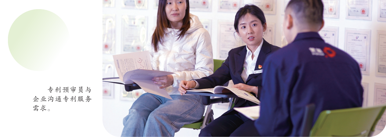
专利预审员与企业沟通专利服务需求。