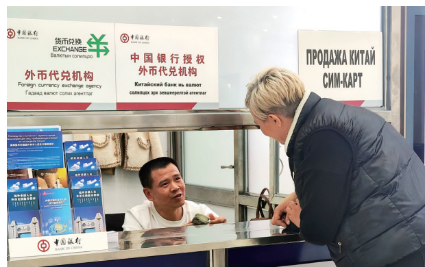
境外来宾服务中心工作人员向外籍游客提供支付咨询服务。

五载砥砺前行,“十四五”规划实施已硕果盈枝;征程赓续前行,“十五五”蓝图擘画正蓄势起笔。中国人民银行内蒙古自治区分行、国家外汇管理局内蒙古自治区分局将继续以习近平新时代中国特色社会主义思想为指引,深入学习贯彻贯彻党的二十届四中全会精神,按照习近平总书记和党中央为内蒙古擘画的宏伟蓝图,继续以发展为题,以实践为笔,为书写中国式现代化内蒙古新篇章贡献更为磅礴的金融力量。