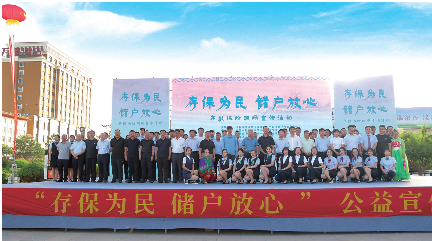
开展“存保为民 储户放心”公益宣传活动。