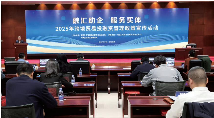
举办“融汇助企 服务实体”宣传会,推动跨境贸易投融资便利化政策在内蒙古落地生根。

重点领域金融风险有序化解。落实落细金融支持地方政府融资平台债务风险化解各项政策举措,稳妥有序推动融资平台退出。立足法定职责全力配合推进中小银行改革化险,全过程做好流动性监测预警保障,助力内蒙古农商行顺利组建。因城施策精准落实房地产金融政策,支持房地产市场平稳健康发展。积极做好金融支持清理拖欠企业账款工作。