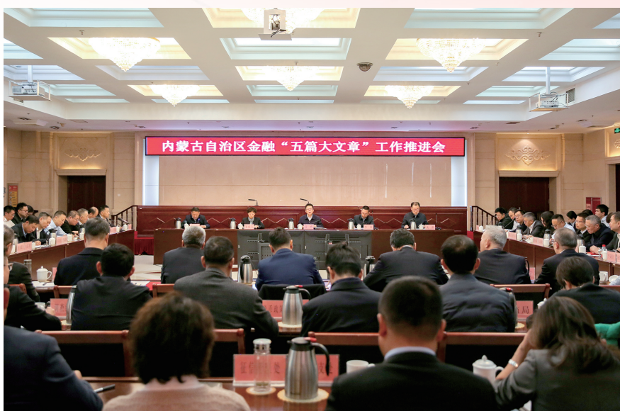
中国人民银行内蒙古自治区分行等四部门联合召开全区金融“五篇大文章”工作推进会。

“十四五”的五年,是时代卷轴上浓墨重彩的篇章。于国家,是迈向现代化新征程的开局起步;于内蒙古,是锚定高质量发展、书写模范自治区新篇章的关键一程。在这片蓬勃发展的热土上,中国人民银行内蒙古自治区分行、国家外汇管理局内蒙古自治区分局始终胸怀“国之大者”,坚持以习近平新时代中国特色社会主义思想为指导,主动服务和融入国家发展战略与自治区发展大局,执金融之笔,蘸实践之墨,奋力书写金融赋能中国式现代化内蒙古新篇章的壮丽答卷。