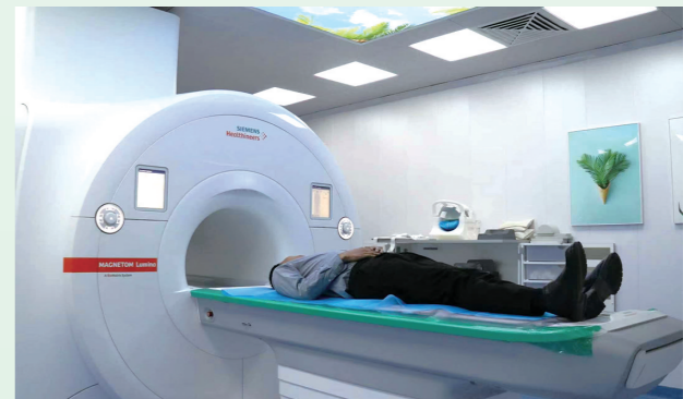
引进先进医疗设备助力临床高效诊疗。