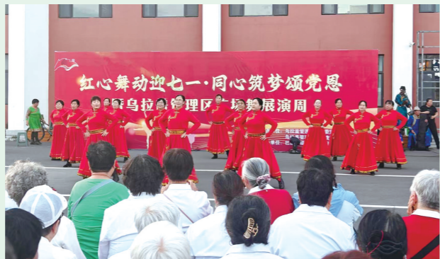
节庆日社区群众走进新时代文明实践中心演绎精彩节目。

聚焦导向引领,群众诉求通道全面优化使更多惠民措施落地,乌拉盖管理区常态化惠民连心行动深得民心,群众的“急难愁盼”事事有回应、件件有着落,社会治理更加从容、更有温度、更富人情味,基层治理水平和治理能力现代化显著提升,一桩桩接地气、贴民心、合民意的民生工程,不仅深度夯实民生基石,更让“天边草原乌拉盖”的民生福祉持续升温。