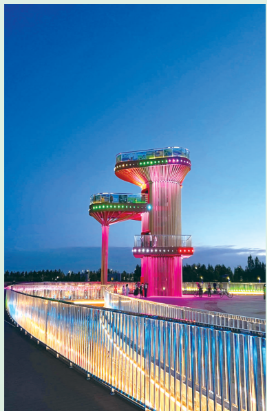
巴彦胡硕镇南湖广场夜景。

春日乌拉盖,沃野藏生机。近年来,乌拉盖管理区各族干部群众凝心聚力,真抓实干,始终锚定“为民造福初心”,从党建统领、人居环境、养老医疗、文化教育等方面多维度发力,一以贯之聚焦群众“急难愁盼”求实效,全面积极回应社会诉求,把一件件民生实事办到群众心坎上,各族群众在共居共学、共建共享、共富共乐互嵌式创新实践中开启共同富裕崭新征程,“共富共享”的阳光正在辐射城乡、照进现实,一幅幅“镇美、民富、业兴、人和”的和美画卷正在乌拉盖草原徐徐铺开。