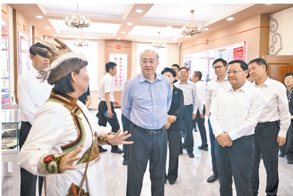
6月25日,北京市党政代表团来到多布库尔猎民村,详细了解乡村振兴、文旅产业发展等情况。

在北京市、内蒙古自治区东西部协作工作座谈会上,尹力向内蒙古自治区党委、政府和全区各族人民对北京市发展的支持表示感谢。他说,开展东西部协作是党中央作出的重大决策部署。习近平总书记高度重视,作出一系列重要指示,提出明确工作要求,为我们做好京蒙协作工作提供了根本遵循。京蒙协作30年来,在各方面共同努力下,各领域都取得了丰硕成果。北京将深入贯彻习近平总书记重要指示精神,不折不扣贯彻落实党中央决策部署,学习借鉴固本培元机制,深化各层级对接合作,拓展协作领域,提升协作水平,在巩固拓展脱贫攻坚成果、推进乡村振兴、助力产业发展、改善生产生活条件等方面持续用力。在守牢不发生规模性返贫致贫底线上下功夫,坚持帮扶资金向乡村振兴重点帮扶县倾斜,优化干部人才选派,深化教育医疗“组团式”帮扶,促进脱贫群众稳定就业,创新农产品进京合作方式,助力当地群众致富增收。在促进民族团结进步上下功夫,办好“京蒙一家亲”主题活动,挖掘内蒙古独特的民族文化资源,联合开发文旅产品。在促进科技成果转化上下功夫,聚焦新材料、生物制造、现代农业等产业加强产学研合作,推动更多创新成果在内蒙古转移转化。在做强特色优势产业上下功夫,做优“呼伦贝尔大草原”生态旅游品牌,建设好共建产业园区,奋力推动京蒙协作不断迈上新台阶。