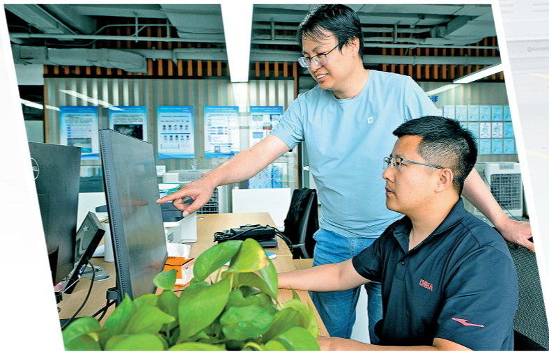
入驻企业讨论项目。