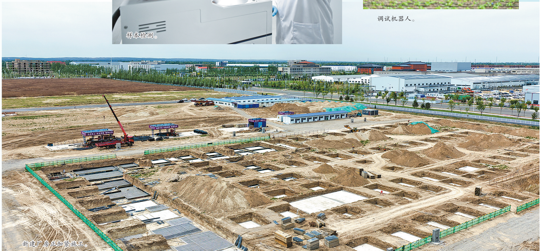
新建厂房正加紧施工。