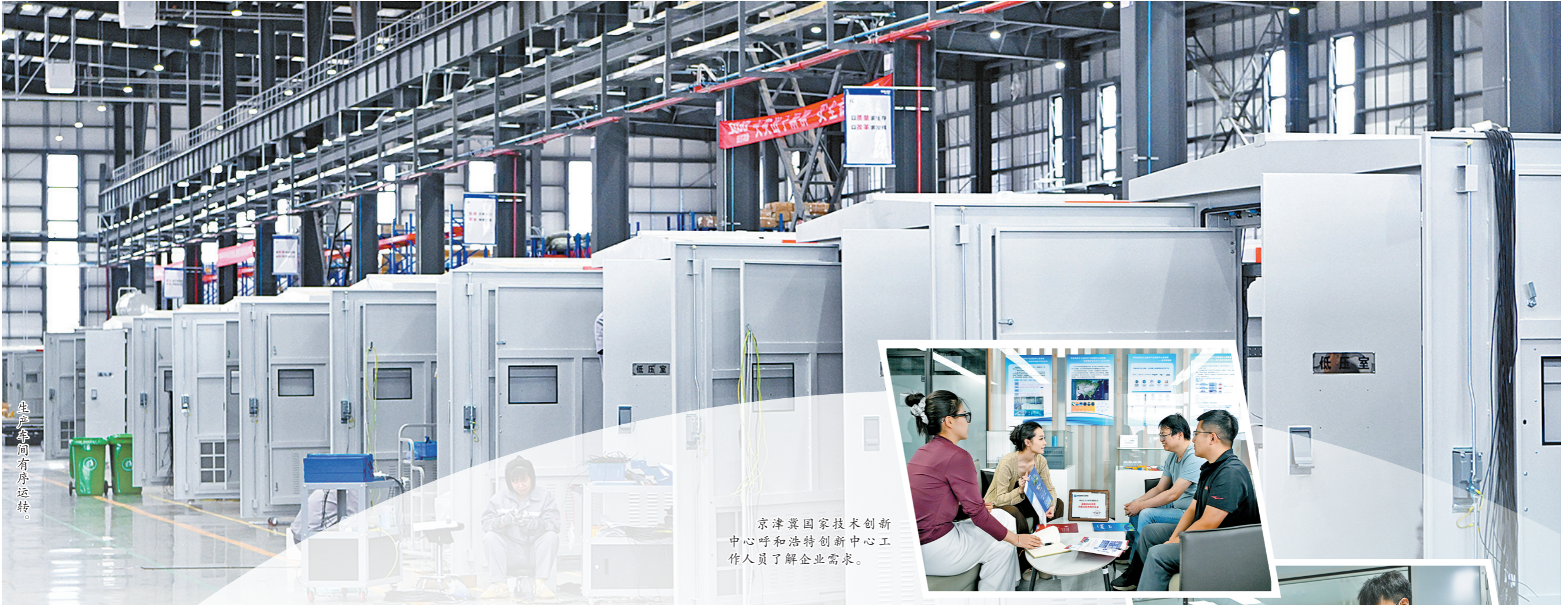
生产空间有序运转。