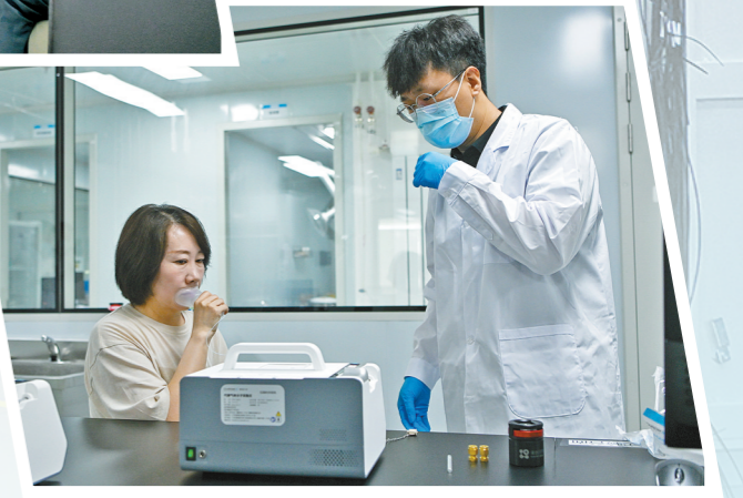
工作人员采集样本。

对着仪器呼气,15到18分钟就能拿到一份肺癌早期风险筛查报告,临床数据验证准确度超过90%。 不久前,来自广州的精智未来智能科技有限公司带着这项全球领先的呼气筛查技术落户青城,呼和浩特市颠覆性技术专项基金向该项目投入专项支持资金,推动技术实现产业化落地。 这样一项颠覆性技术,为什么跨越千里选中呼和浩特? “我们看中的是这里系统化的支持。”内蒙古精智未来项目负责人陈旭坦言,从政策引导、场景开放到基金投资,多个环节对企业的支持形成合力,“颠覆性技术产业化最难的不是技术验证,而是在真实人群中完成价值证明,呼和浩特提供的正是这个。” 这种系统化支持并非只面向精智未来一家。2024年,呼和浩特市政府与京津冀国家技术创新中心签署战略合作协议,成立京津冀国家技术创新中心呼和浩特创新中心。依托中心而设立的呼和浩特市颠覆