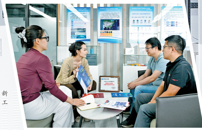
京津冀国家技术创新中心呼和浩特创新中心工作人员了解企业需求。