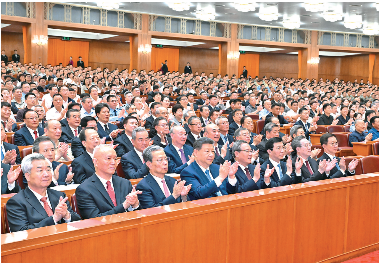
6月29日晚,庆祝中国共产党成立105周年音乐会《人民至上》在北京举行。习近平、李强、赵乐际、王沪宁、蔡奇、丁薛祥、李希、韩正等党和国家领导人,同约3000名观众一起观看演出。

新华社北京6月29日电 深情乐章致敬辉煌历程,嘹亮歌声唱响人民史诗。庆祝中国共产党成立105周年音乐会《人民至上》29日晚在京举行。习近平、李强、赵乐际、王沪宁、蔡奇、丁薛祥、李希、韩正等党和国家领导人,同约3000名观众一起观看演出,共同庆祝这个光辉的节日。人民大会堂华灯璀璨,洋溢着喜庆的气氛。19时55分,在欢快的乐曲声中,习近平等党和国家领导人来到音乐会现场,全场响起热烈的掌声。