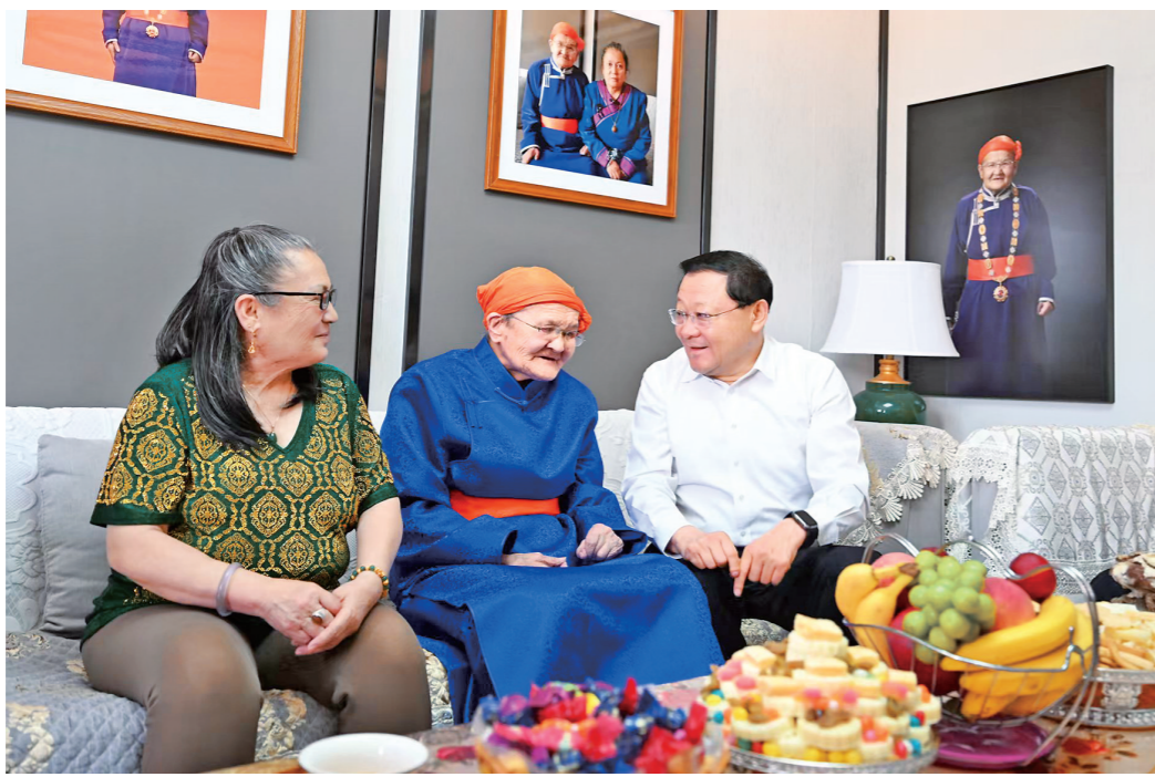
6月29日,自治区党委书记、人大常委会主任王伟中在四子王旗看望慰问“人民楷模”都贵玛。

本报6月29日讯(记者 李晗)在中国共产党成立105周年即将到来之际,6月29日,自治区党委书记、人大常委会主任王伟中深入四子王旗,看望慰问“人民楷模”都贵玛,代表自治区党委向全区广大党员和党务工作者致以诚挚问候和节日祝福,并围绕推进乡村全面振兴开展调研。都贵玛是有着50多年党龄的老党员。“三子孤儿入内蒙”年代,年仅19岁的都贵玛主动承担了28名孤儿的养育任务,把最美的年华献给了“国家的孩子”。王伟中来到都贵玛家中,与老人亲切交谈,关切询问她的身体状况和生活情况,祝她健康快乐。王伟中说,您用半个世纪的真情付出,生动诠释了中华民族大家庭中各族同胞手足相亲、守望相助,是共产党人服务人民的标杆榜样,值得我们好好学习。全区广大党员干部要始终牢记老一辈共产党人的无私奉献和突出贡献,赓续优良传统,牢记初心使命,持续深入学习领悟习近平新时代中国特色社会主义思想对内蒙古系列重要讲话重要指示精神,树立和践行正确政绩观,提速提效落实自治区党委“1571”工作部署,扎实推动高质量发展,努力在内蒙古现代化建设中展现新作为、创造新业绩。王伟中对乡村全面振兴情况非常关心。他走进赛诺羊科技有限公司、中加农业生物科技有限公司,与企业负责人、科研人员深入交流,详细了解肉羊和马铃薯技术研发、生产经营、联农带农等情况,勉励企业发挥特色优势,精准对接市场需求,加强专业化人才引育,一手抓良种研发繁育,高质